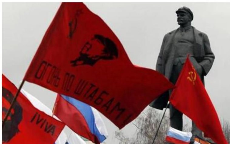
Bandeiras comunistas e monumento à Lênin, em Donetsk