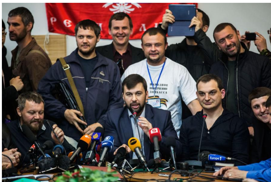
Direção revolucionária da República Popular de Donetsk

coisa que OS PRINCÍPIOS DA REPÚBLICA SOVIÉTICA, infinitamente superior a situar o curso dentro de problemas regionais ou étnicos somente, e ainda anteriores à revolução russa de Outubro de 1917. Estes acontecimentos se dão, não por acaso, em uma área PROLETÁRIA DA UCRÂNIA. Isto é uma CONCLUSÃO POLÍTICA REVOLUCIONÁRIA. Acharmos que estão se abrindo as "portas e