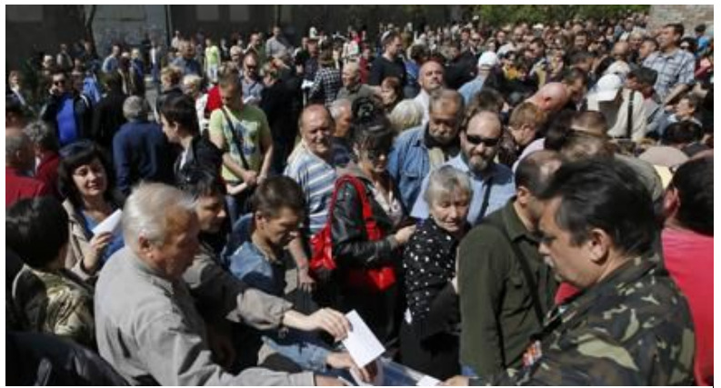
Assembleia popular votando pela República Popular